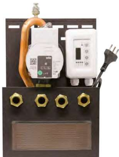
Dimensioni 10 x 25 x 37 cm (PxBxH)