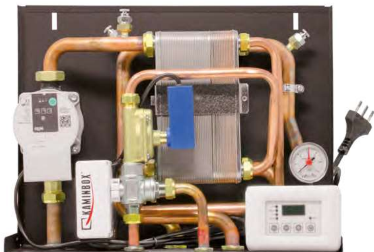
Dimensioni 14,5 x 47 x 34 cm (PxBxH)