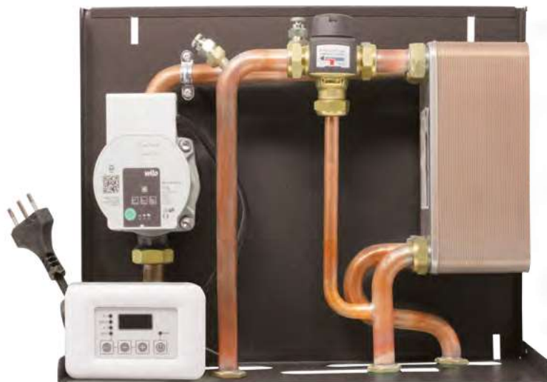
Dimensioni 12 x 32 x 28 cm (PxBxH)