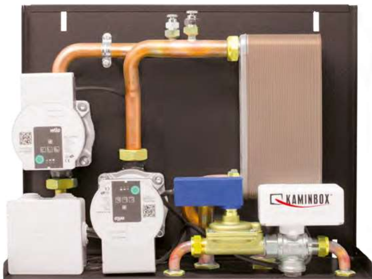
Dimensioni 14,5 x 40 x 34 cm (PxBxH)