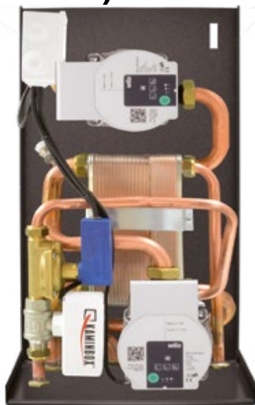
Dimensioni 25 x 30,5 x 51 cm (PxBxH)