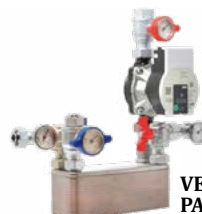
Kit idropellet 3 Preassemblato 13x35x35 cm (PxBxH)