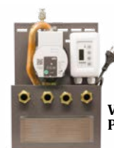
Kit idropellet 5 10x25x37 cm (PxBxH)