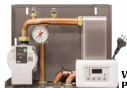
Kit idropellet 3 14,5x35x27 cm (PxBxH)