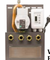
Kit idropellet 5 10x25x37 cm (PxBxH)