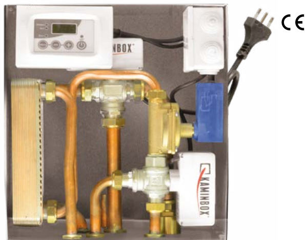
Dimensioni: 13,5 x 28,5 x 32 cm (PxBxH)