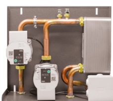
Kit 2 orizzontale 14,5x40x34 cm (PxBxH)