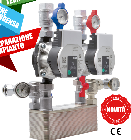
Dimensioni: 15 x 35 x 35 cm (PxBxH)

CONTROLLO DELLE TEMPERATURE FUNZIONE ANTICONDENSA SEPARAZIONE IMPIANTO