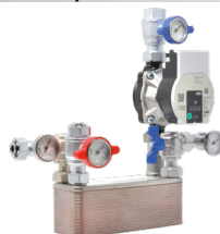
Kit idropellet 3 Preassemblato 13x35x35 cm (PxBxH)