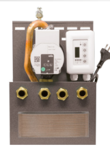
Kit idropellet 5 10x25x37 cm (PxBxH)