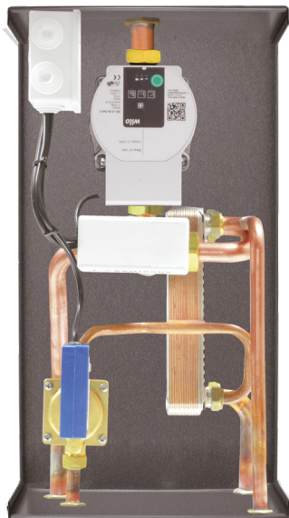
Dimensioni: 27x27x47 cm (PxBxH)