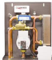
Kit 3 orizzontale 14,5 x 33 x 39 cm (PxBxH)