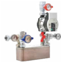
Kit idropellet 3 Preassemblato 13x35x35 cm (PxBxH)