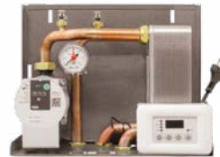
Kit idropellet 3 14,5x35x27 cm (PxBxH)