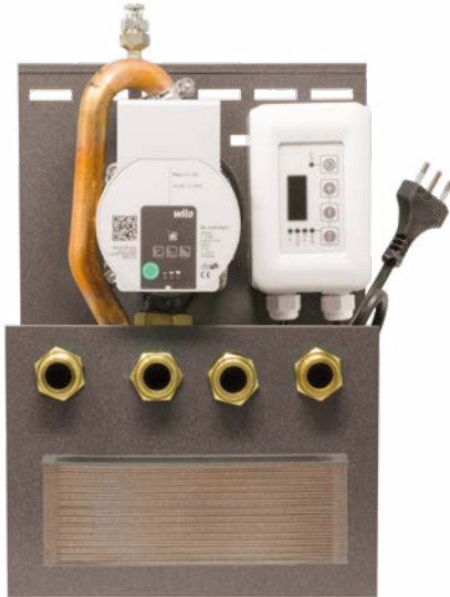
Dimensioni: 10 x 25 x 37 cm (PxBxH)