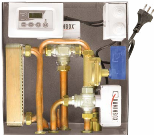
Dimensioni: 13,5 x 28,5 x 32 cm (PxBxH)