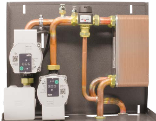
Dimensioni: 15 x 44 x 34 cm (PxBxH)