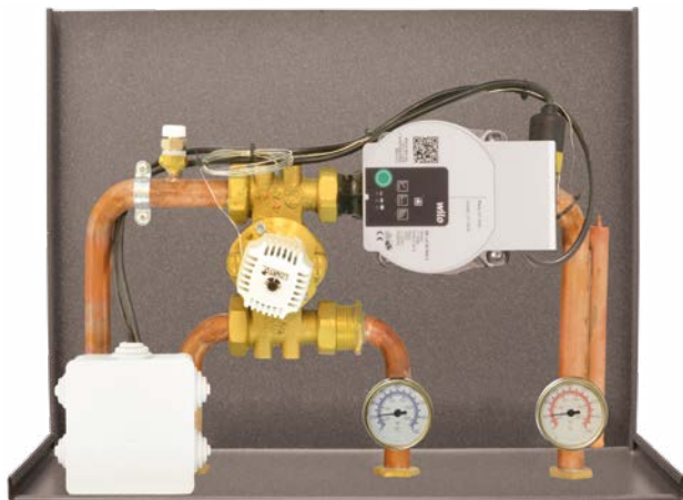
Dimensioni: 16 x 44,5 x 34 cm (PxBxH)