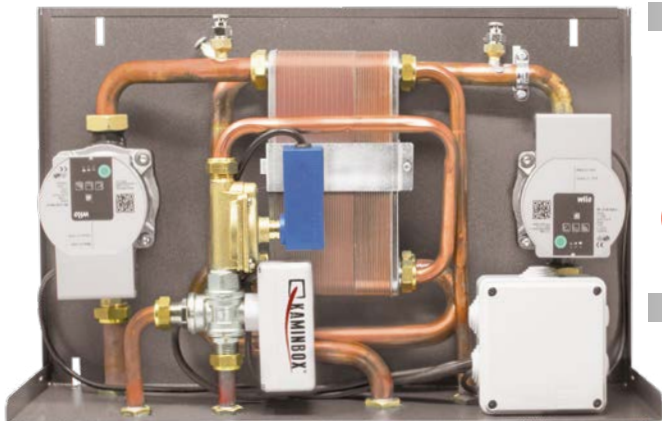
Dimensioni: 14,5 x 54,5 x 34 cm (PxBxH)