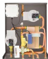
Kit 1 K 14,5x42x48,5 cm (PxBxH)