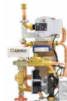
Kit 1 SC 20x26x42 cm (PxBxH)