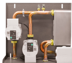
Kit 2 orizzontale 14,5 x 40 x 34 cm (PxBxH)