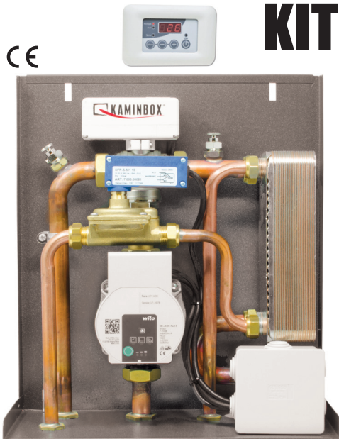
Dimensioni: 14,5 x 33 x 39 cm (PxBxH)